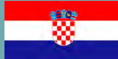
HRVATSKA (Croatia) ZAGREB VRTIĆ TATJANE MARINIĆ