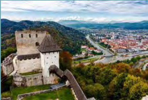
SLOVENIJA (Slovenia) CELJE VRTEC VESELA HIŠA